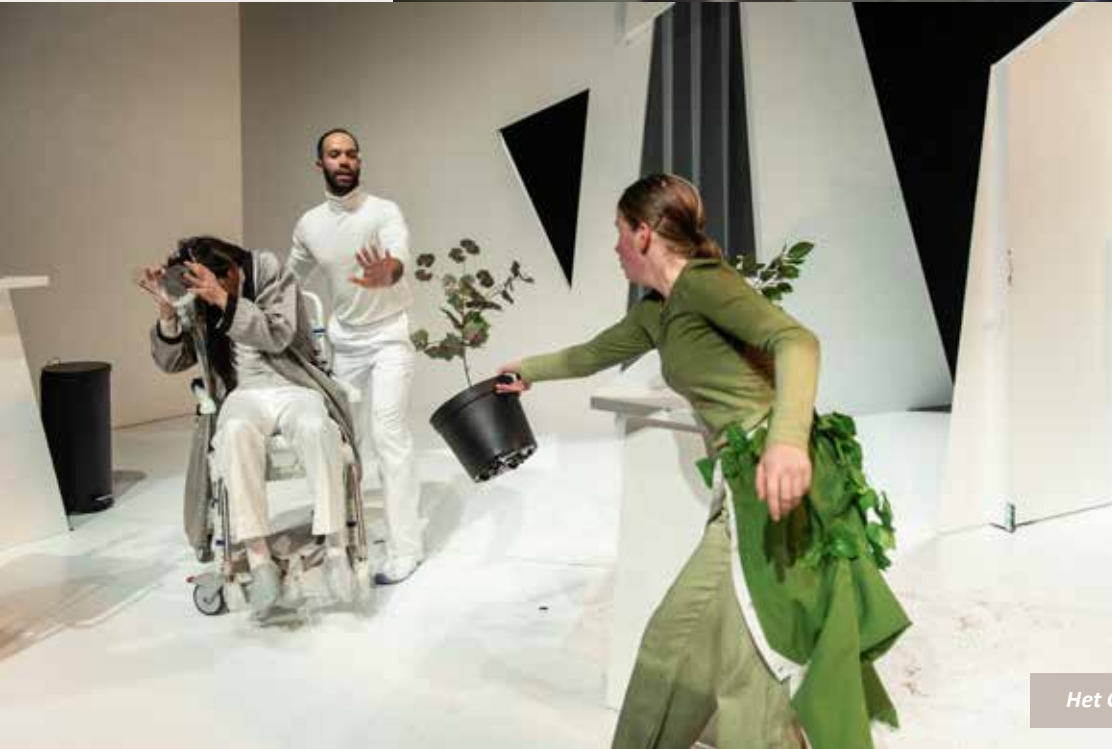
Het Groene Meisje door MaxTak