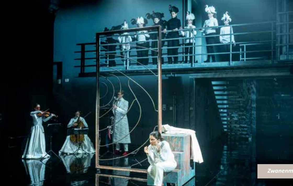
Zwanenmeer door Holland Opera