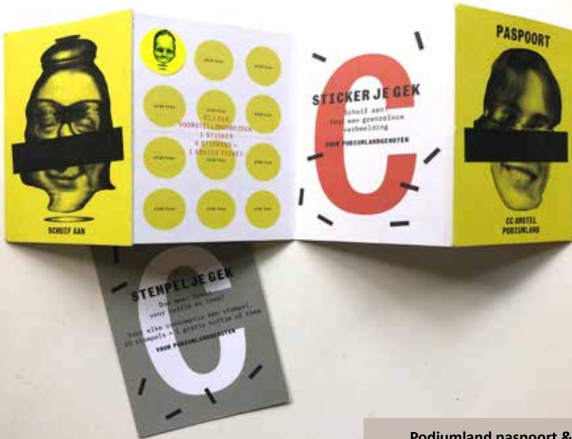
Podiumland paspoort & overalls