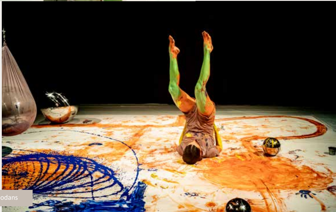
KLeuR door Dadodans