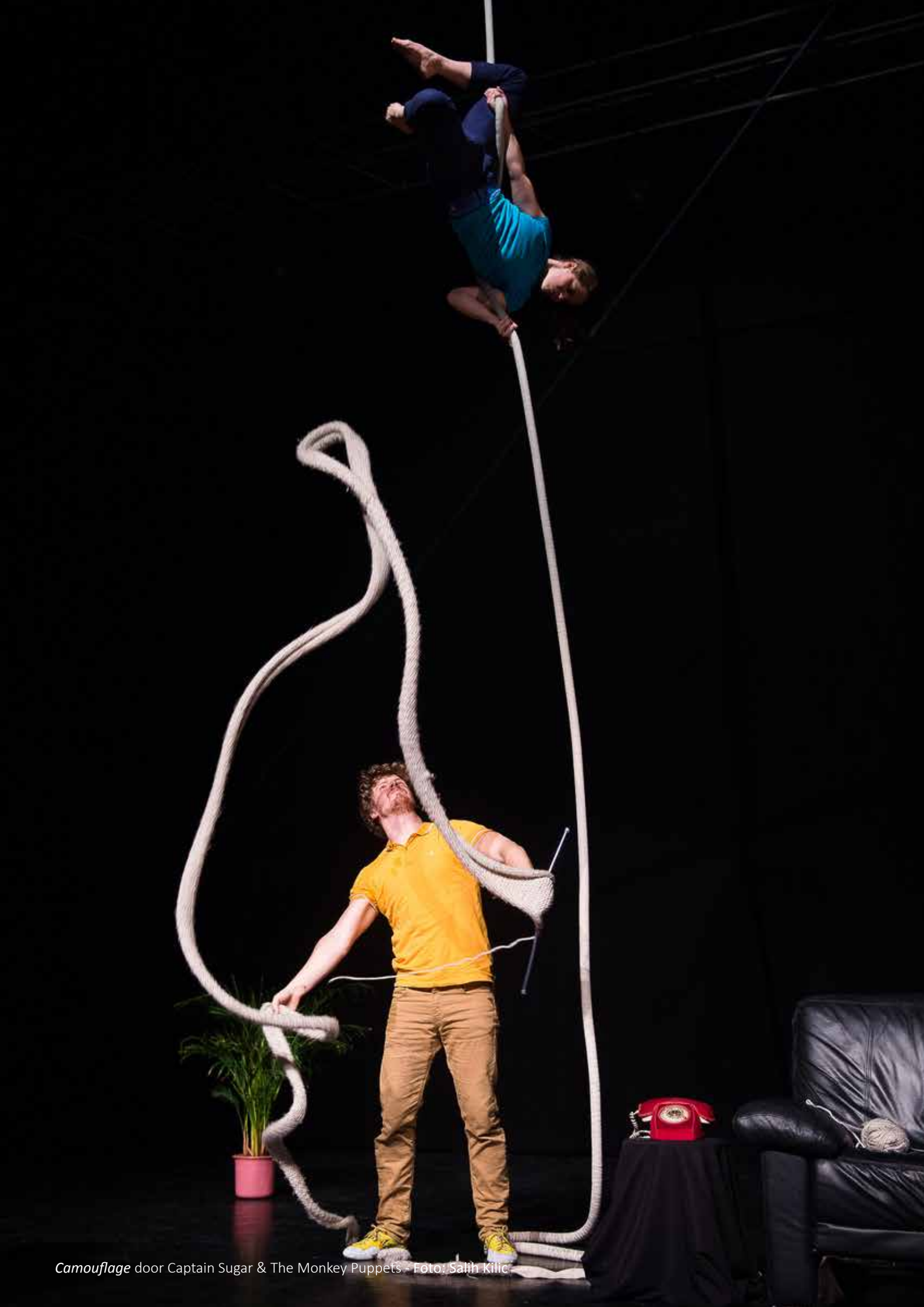
Camouflage door Captain Sugar & The Monkey Puppets