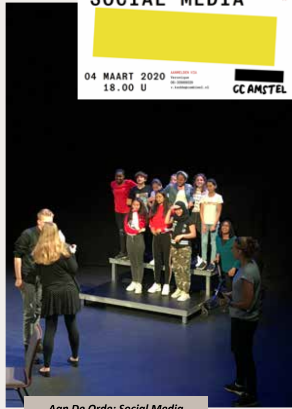
Aan De Orde: Social Media