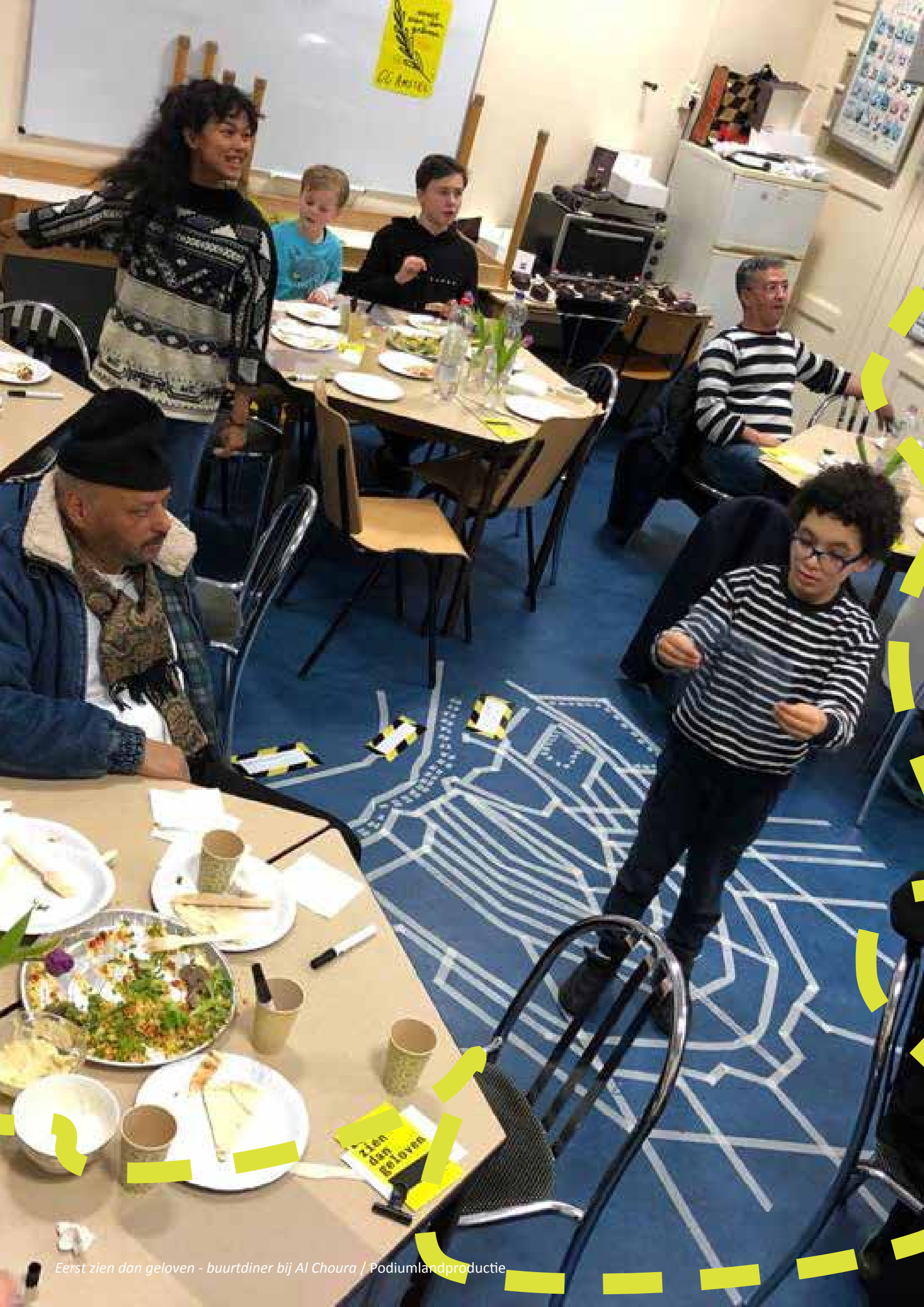
Eerst zien dan geloven - buurtdiner bij Al Choura / Podiumlandproductie