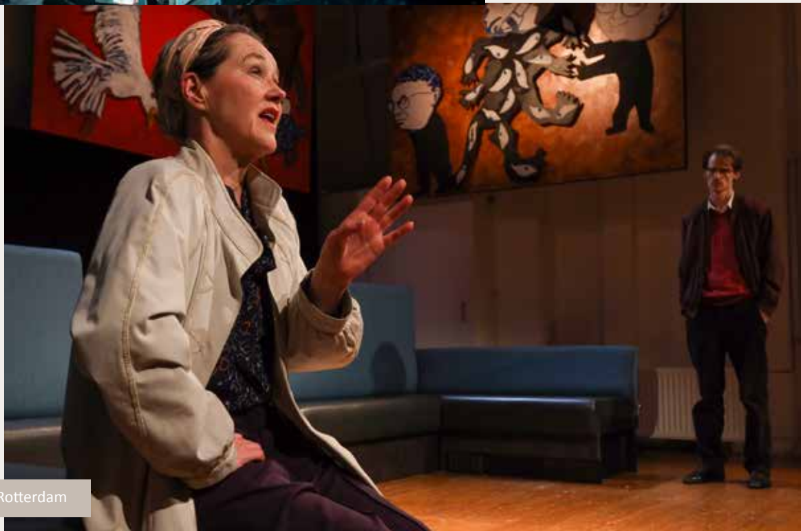
Leven zonder Sartre door OT Rotterdam