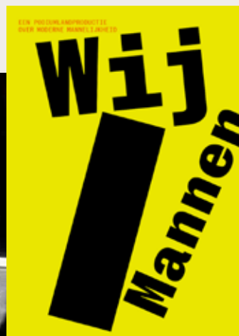
Wij Mannen #3 en #4