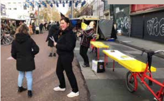
Eerst Zien Dan Geloven