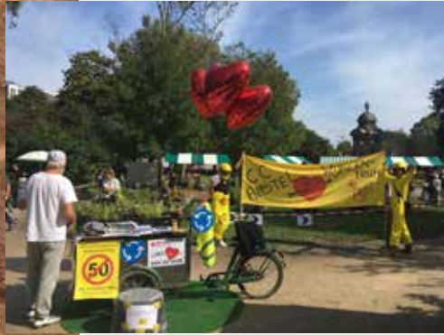
Reddingsactie Wijkcentrum de Pijp