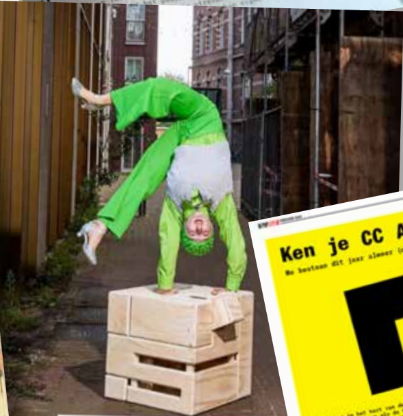
CC AMSTEL + BOOST FOR THE CELEBRATION OF AMSTERDAM 750 YEARS WITH CIRCUS AROUND THE BLOCK 🍓